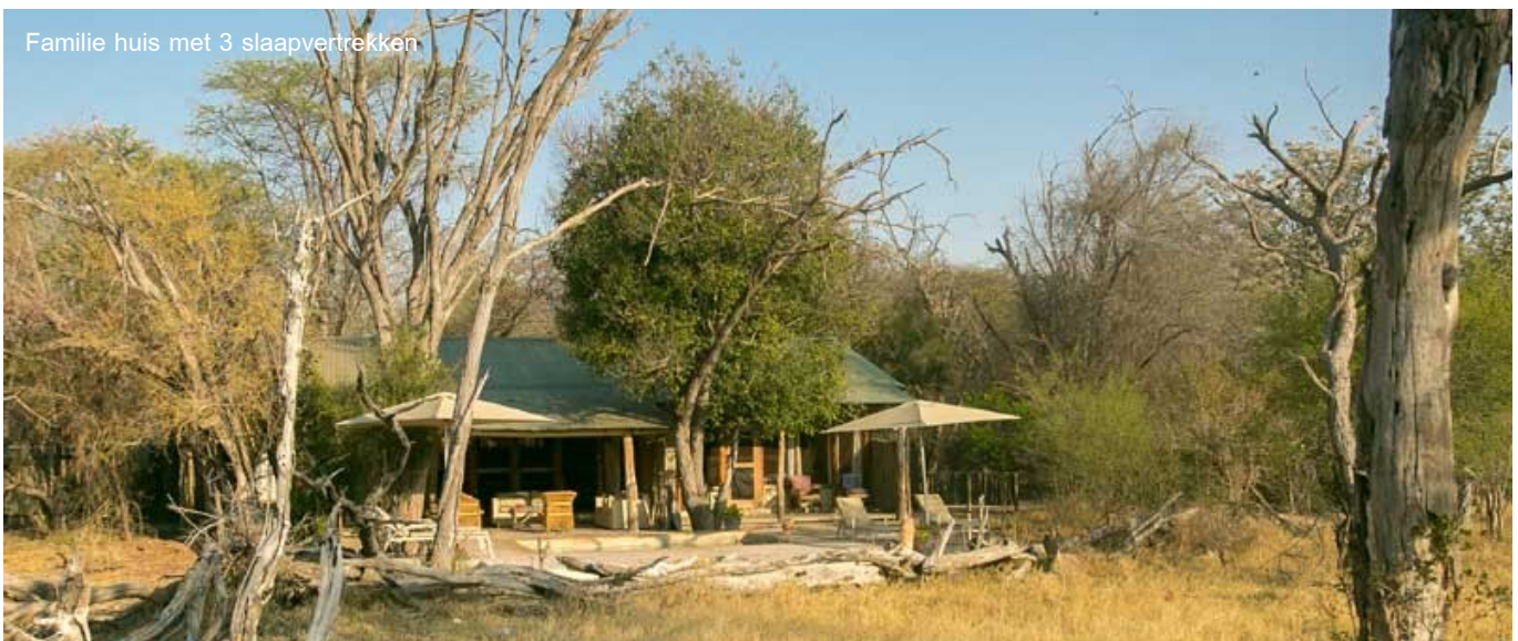
Familie huis met 3 slaapvertrekken